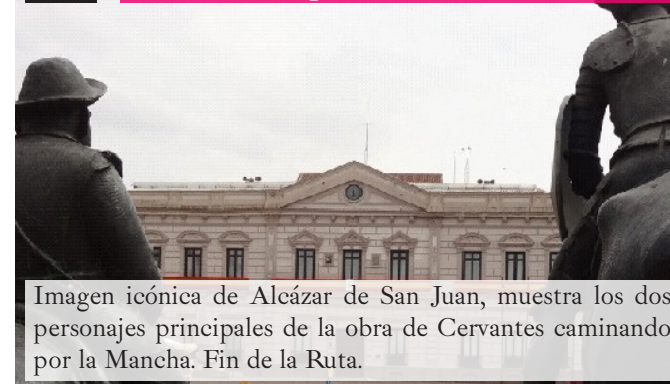
Imagen icónica de Alcázar de San Juan, muestra los dos personajes principales de la obra de Cervantes caminando por la Mancha. Fin de la Ruta.